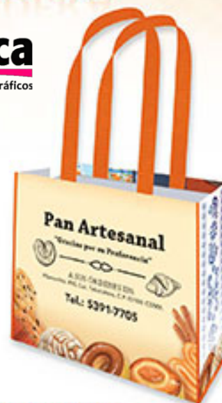
BOLSA HORIZONTAL BP 110 Pan, Chocolate y Café