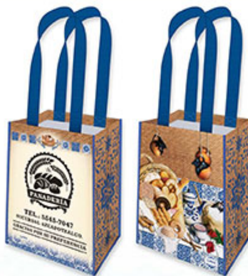
BT 08 Dulce Merienda