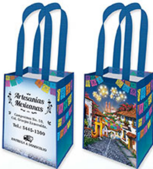
BT 01 Fiesta de Mi Pueblo