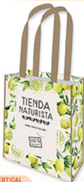
BOLSA VERTICAL BP 11 Limonero