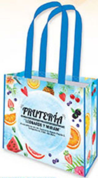
BOLSA HORIZONTAL BP 05 Frutas Frescas