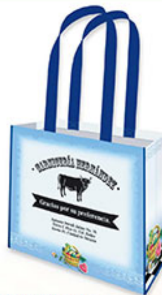
BOLSA HORIZONTAL BP 112 Pizpireta