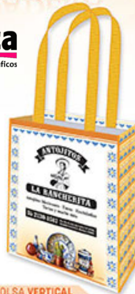
BOLSA VERTICAL BP 106 Sazón Mexicano