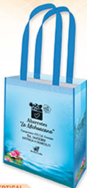
BOLSA VERTICAL BP 09 Princesa Ancestral