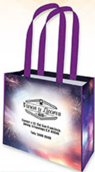
BOLSA HORIZONTAL BP 01 Noche en París