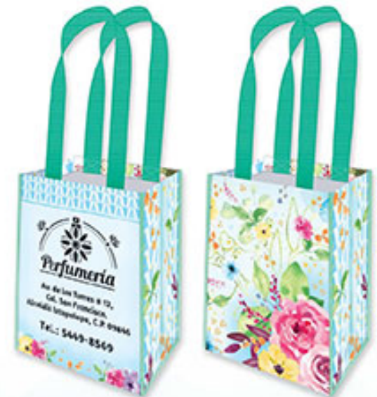
BT 03 Acuarela Floral