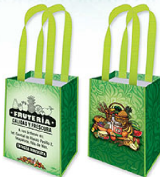
BT 05 El Buen Comer