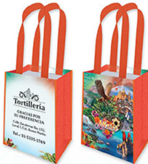
BT 02 Riquezas de Nuestro México