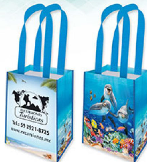
BT 06 Sonrisas Bajo el Mar