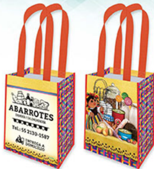
BT 04 Mi Despensa Favorita