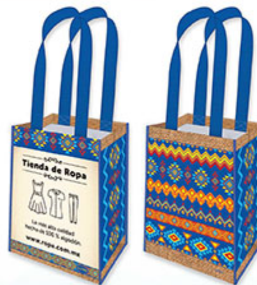
BT 09 Armonía de Color