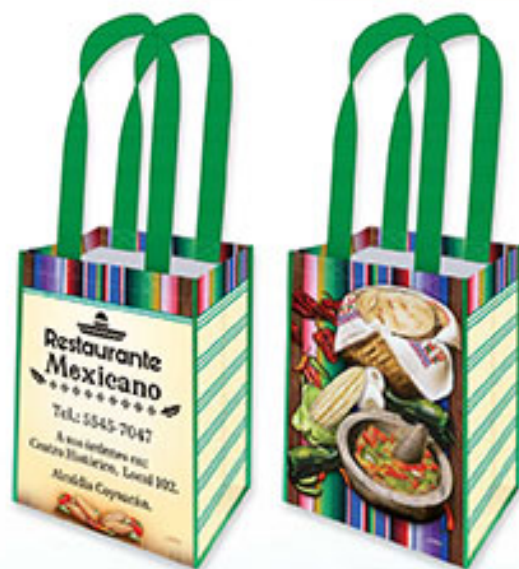
BT 07 Los Sabores de México